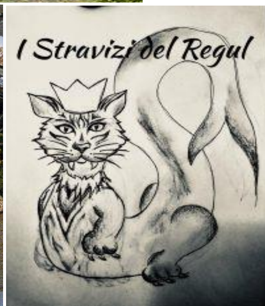
Panorama - Castello Brancaleone – I Stravizi del Regul